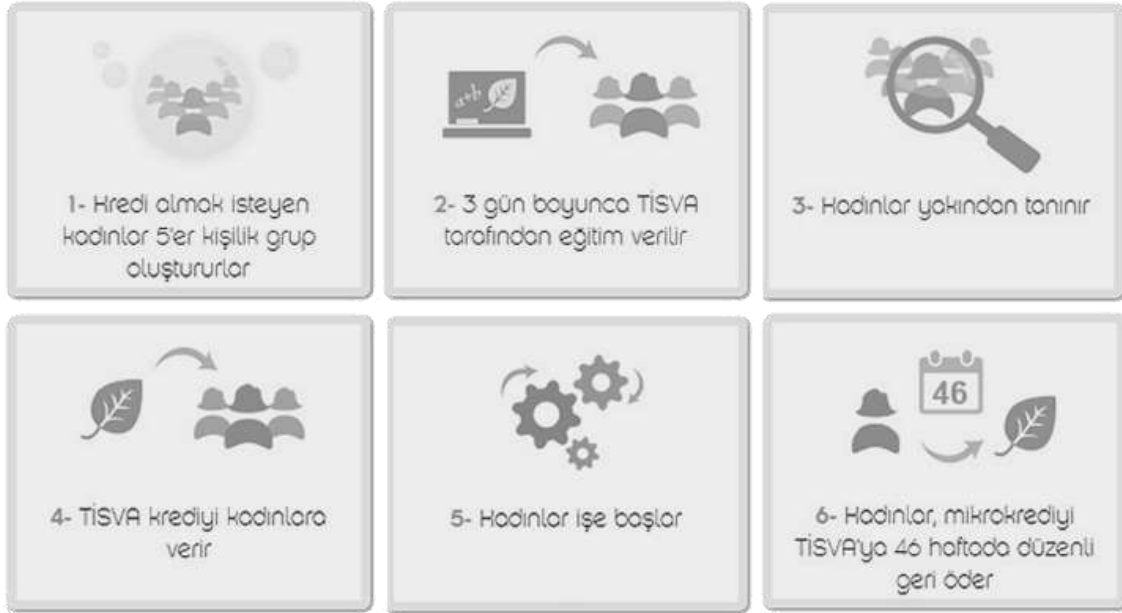
Şekil 2: Mikro Kredi Alma Süreci