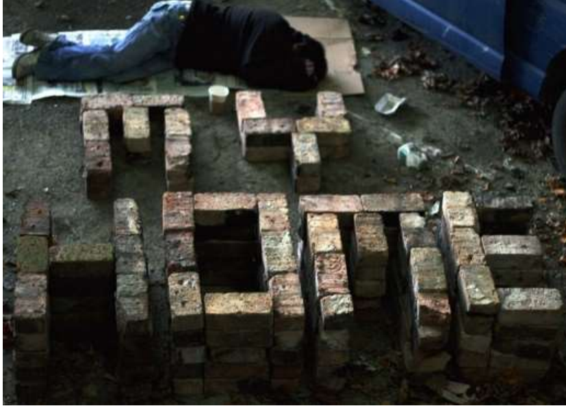
Resim 2. Christopher Scott, Put Yourself in Their Shoes, 2011.