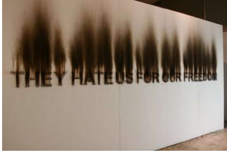
Resim 11. Claire Fontaine, They Hate Us For Our Freedom, 2008.