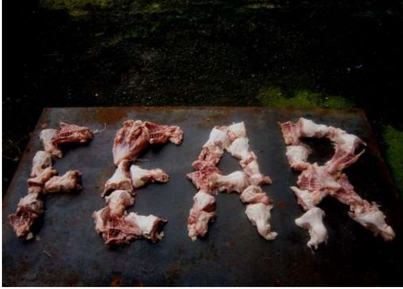
Resim 1. Christopher Scott, Put Yourself in Their Shoes, 2011.