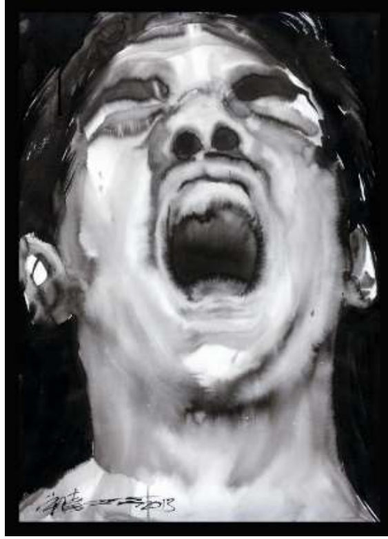
Resim 7. Song Ling, Face 82, 2013.