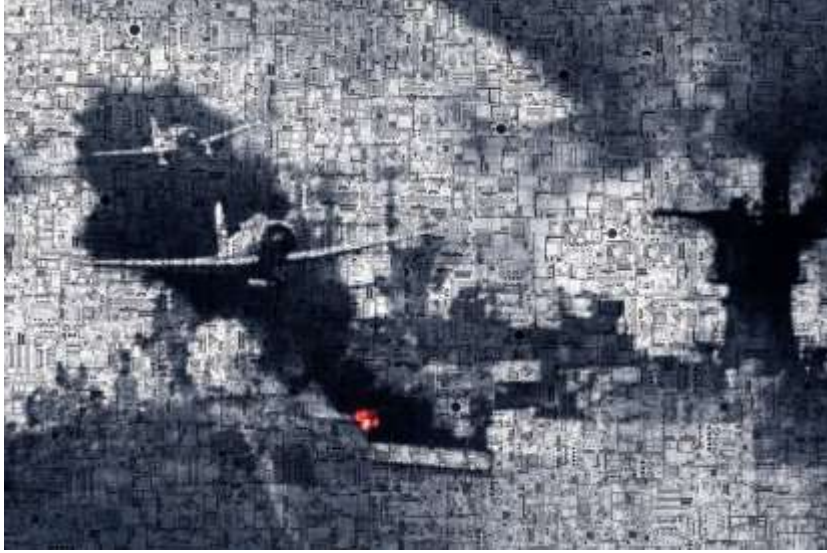
Resim 4. Ali Alışır, Virtual Wars, 2013.