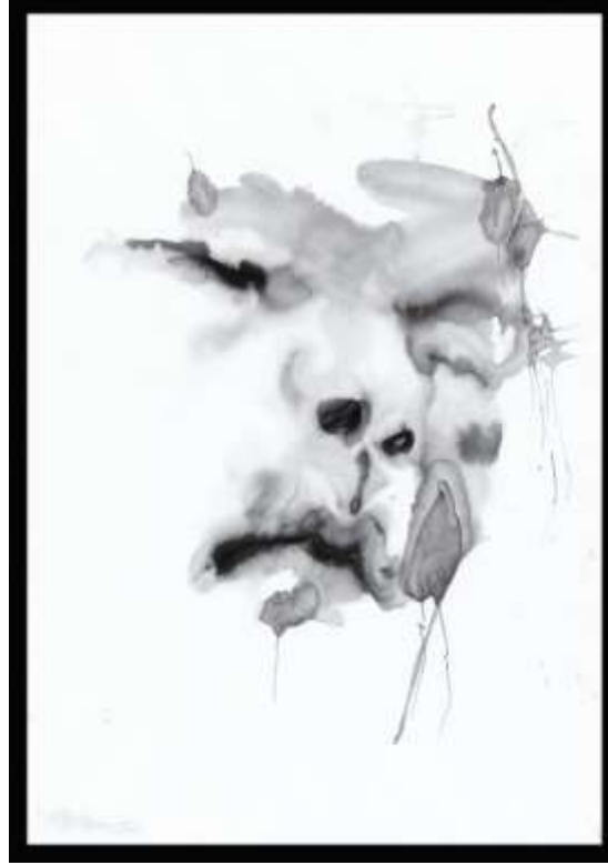
Resim 6. Song Ling, Face 80, 2013.